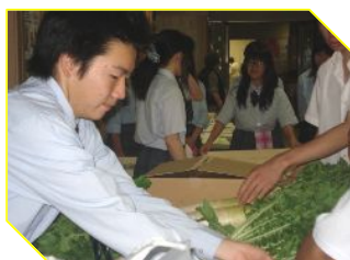
相原高校生による新鮮野菜と 中華まん・手作りお菓子の販売