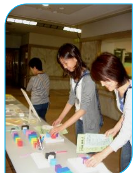
カラーセラピーで癒しのひとときを