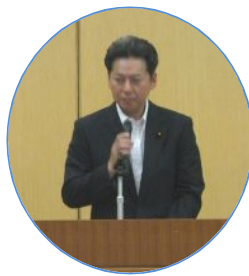
中村市議会議長御挨拶