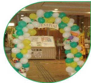
バルーンから入場