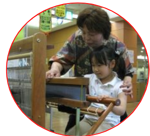
織りつなごう！裂き織り