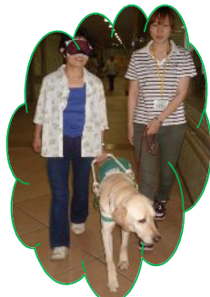
盲導犬について知る！ 来館者の体験