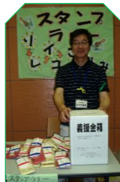
東日本大震災の 義援金箱設置