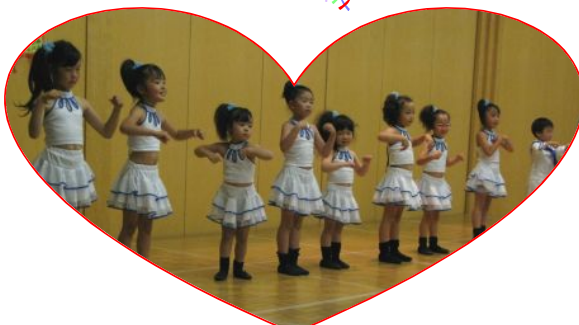
キッズのジャズダンス かわいさに思わず笑顔が・・・