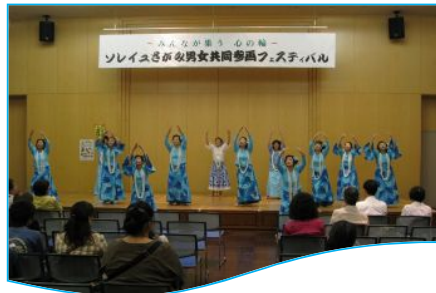
恒例のフラダンス しなやかに美しく