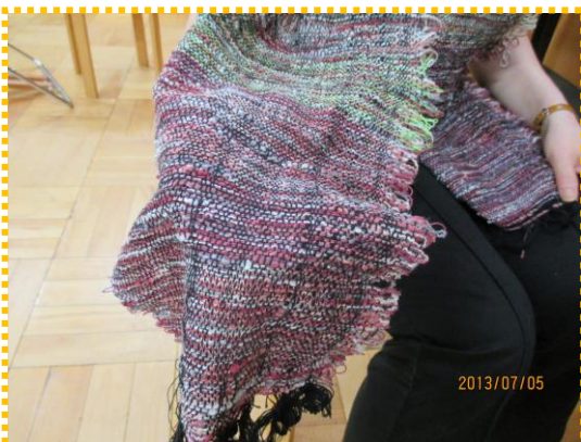
以前の参加者作品です