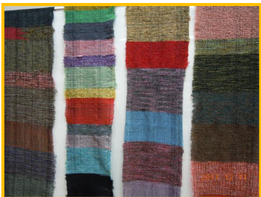
以前の参加者作品です